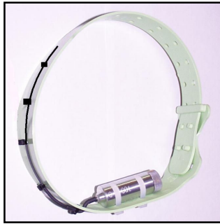
Foto A. El transmisor adosado al collar para un perro de caza facilita la localización de un animal herido o encelado con la presa. El ejemplar mostrado pesa 30g, i tiene un alcance de hasta 50 km y una autonomía de 20 a 30 días según la actividad del sensor de movimiento.

La idea de incorporar un transmisor de radio a ejemplares concretos, en vez de anillarlos y poder seguir así su trayectoria, era muy tentadora, pero las dificultades técnicas eran considerables; el tamaño y peso del equipo debían ser muy reducidos para no alterar sustancialmente el comportamiento del animal (y pensemos cuál debe ser la carga máxima tolerada por un halcón o un ave más pequeña, como una codorniz o un cuco); por otro lado, el alcance de la señal debía ser suficiente para permitir su escucha con un receptor de tecnología usual y, por último, es obligado que la autonomía de la fuente de alimentación sea bastante prolongada para permitir un estudio de suficiente entidad o para proseguir durante varios días la búsqueda de un valioso ejemplar perdido.