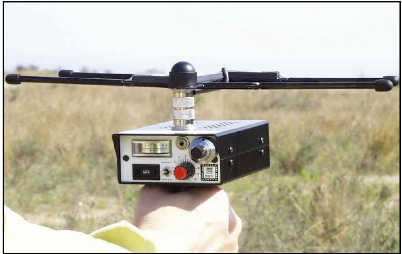
Receptor de 432 MHz.

Las bandas más populares para esa actividad son la de 3,5 MHz (80 metros), 27 MHz (11 metros) o la de 144 MHz (2 metros), aunque pueden usarse otras cualesquiera, dentro de las asignadas a los radioaficionados. En cualquiera de ellas, el problema principal es diseñar una antena direccional eficaz y de tamaño manejable por el "cazador... En la banda de 80 metros lo común es utilizar una antena de ferrita, que proporciona una aguda discriminación direc-