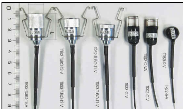
Foto B. Algunos de los transmisores usados en cetrería. El emisor de la izquierda pesa 159 Y tiene un alcance de más de 50 km, con una autonomía de 6 días, mientras que el ejemplar de la derecha pesa solamente 2,8 9 Y puede ser escuchado a 8 km durante 4 días.

El reto de lograr un transmisor eficiente con un peso limitado a unos pocos gramos era considerablemente difícil, pero, como reza un anuncio de una conocida marca de automóviles, todos los desafíos lo son. Utilizando componentes microminiatura, entre los que se incluyen osciladores de cuarzo a sobretono de buena estabilidad y pilas subminiatura, la empresa Ayama-Segute/ ofrece 37 modelos de transmisores que cubren una amplia gama, desde los increíbles modelos subminiatura, con un peso de ¡un gramo! con una potencia de salida de -25 dBm y una autonomía entre 21 y 51 días (categoría 3), hasta un ejemplar de 180 g, que entrega +13 dBm durante un periodo máximo ¡de más de cuatro años! (categoría 9-10).