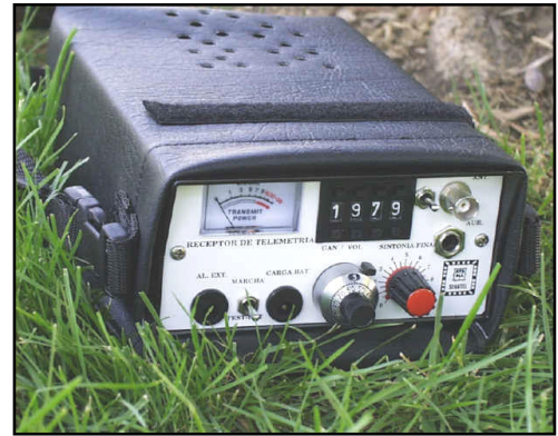
Foto C. El receptor tipo 116, en sus diversas variantes, puede cubrir 400 canales de 10 kHz en cada uno de los márgenes de 4 MHz en seis bandas de V-UHF a elegir.